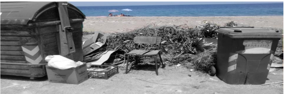
Rossano discarica occasionale mese di Giugno 2019

Ci si domanda perché un paio di scarpe o una sedia abbandonata in una discarica o per strada non richiamano lo stesso interesse o, meglio, non rientrano nelle categorie artistiche e, al contrario, in Vincent van Gogh lo sono?