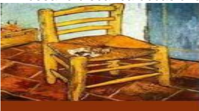
dipinto del 1888. attualmente tenuto dalla National Gallery di Londra. Sedia su pavimento piastrellato.